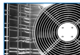
Reparto uniforme del aire