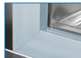
Marco calefactado. Evita condensación y hielo