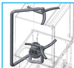
Bomba de doble flujo

GARANTÍA CONDICIONADA A USO, PRODUCTO E INSTALACIONES ADECUADAS