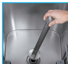
Sistema de desagüe para renovación de agua