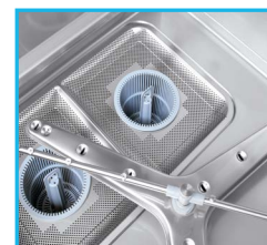
Brazos en acero