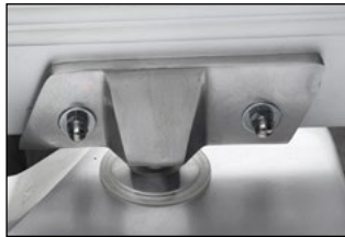
Posibilidad de ajuste plato cuchilla