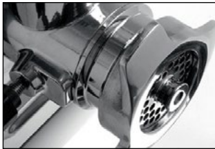
Alta resistencia al desgaste