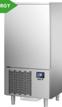
ABATIDOR 10 STAND