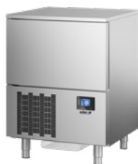
ABATIDOR 3 STAND