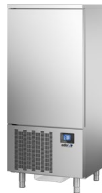
ABATIDOR 15 STAND