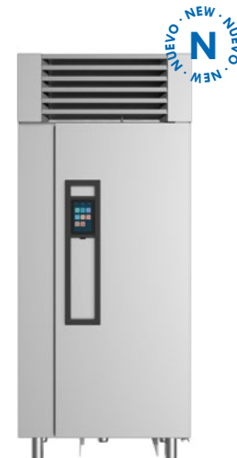
ABATIDOR 20 ROLLOUT