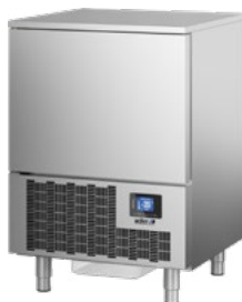
ABATIDOR 5 STAND