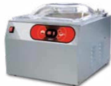
ERMETIKA - SPRINT - SUPERIOR