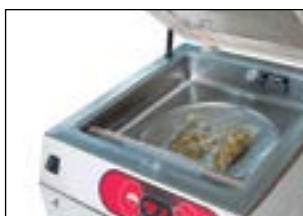
Amplia apertura para la inserción de productos.