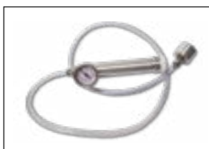
MANGUERA GASTROVAC PVP 225€ (opcional)