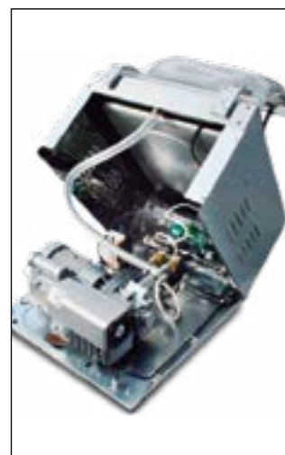
Fácil acceso a los componentes.