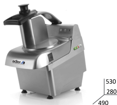
CVP- 400 - 6D