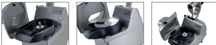
Optimización de limpieza de componentes, gracias a las piezas desmontables de fácil extracción.