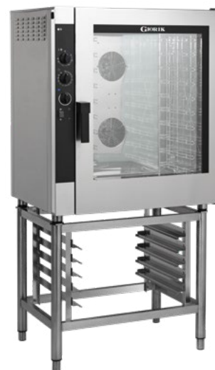
NEME102 - NEMG102