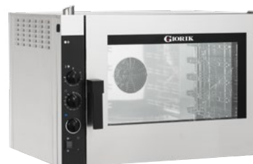
NEME52 - NEMG52