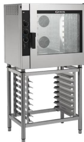
NEME72 - NEMG72