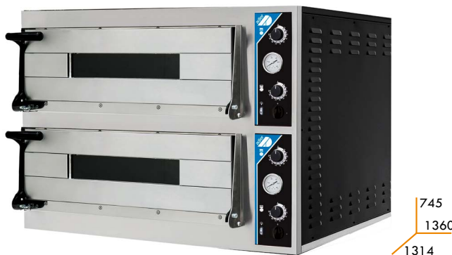
PIZZA MAXI 9D35+ 9D35