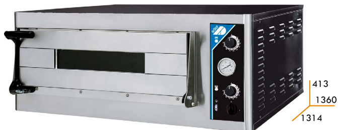
PIZZA MAXI 9D35