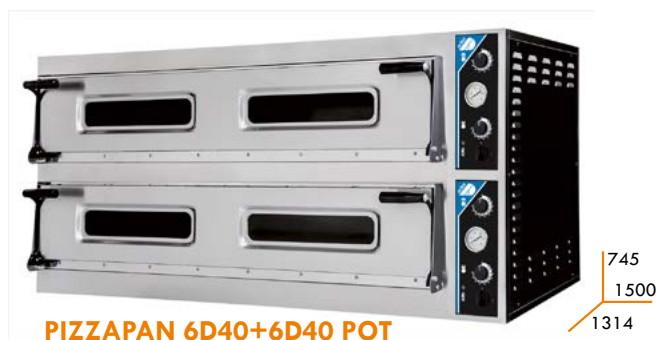
PIZZAPAN 6D40+6D40 POT