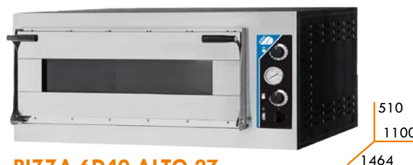
PIZZA 6D40 ALTO 27

Esta versión ofrece una cámara con altura aumentada de 9,5cm respecto a los otros modelos (La altura total de la cámara es de 27cm).