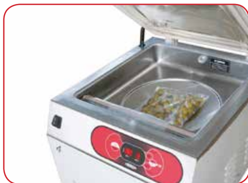
Amplia apertura para la inserción de productos