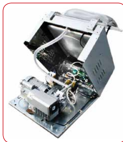
Fácil acceso a los componentes