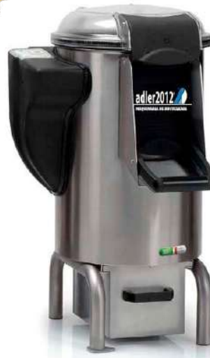
PLP 10 KG - 18 KG