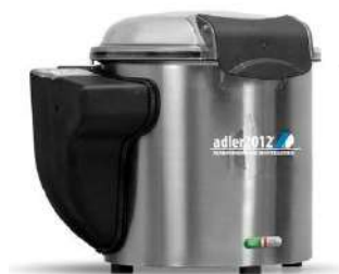
LPM 5 KG