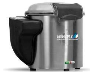
PLP 5 KG