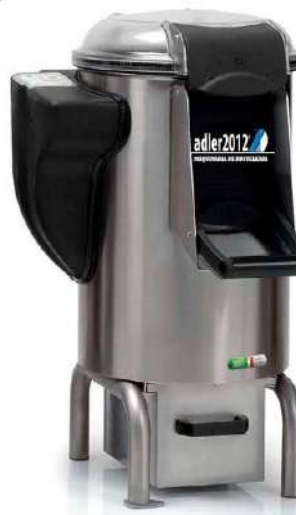
LPM 10 KG - 18 KG