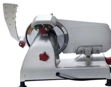
Espesor plato 0.5 cm Permite corte más regular