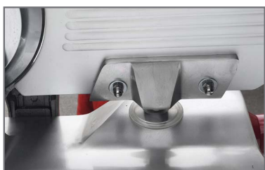
Posibilidad de ajuste plato cuchilla