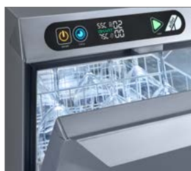
Display digital visual e intuitivo.