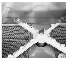
Brazos desmontables en PVC alimentario y fibra de vidrio (30%)