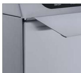
Tirador robusto en acero INOX.