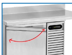
Puerta de cierre automático y bloqueo a 100°