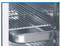
Interior preparado para rejilla/cubeta GN 1/1