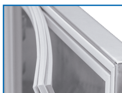
Juntas magnéticas de fácil cambio