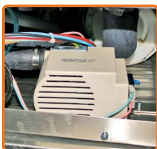
Bomba de descarga