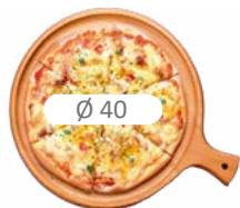
PIZZA 4D40+ 4D40