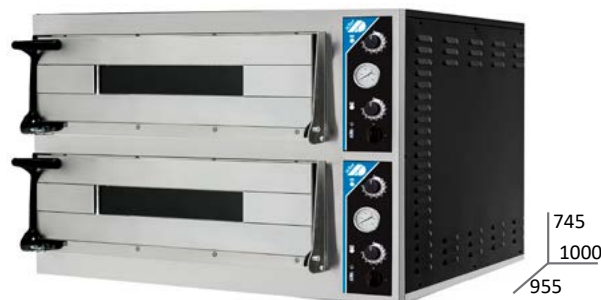
PIZZA MAXI 4D35+ 4D35