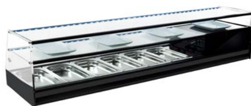
VT- 2P-P 6