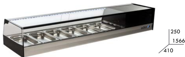
VT- P 6