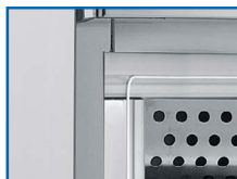
Materiales de calidad y resistencia