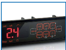
Controlador electrónico programable