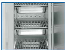
5 contenedores GN 1/1 en modo abatimiento