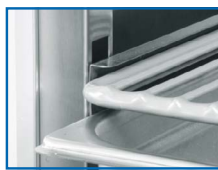
Estantes en E para rejillas y recipientes GN 1/1