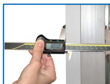
Aislamiento ecológico con 80 mm de espesor