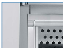
Materiales de calidad y resistencia